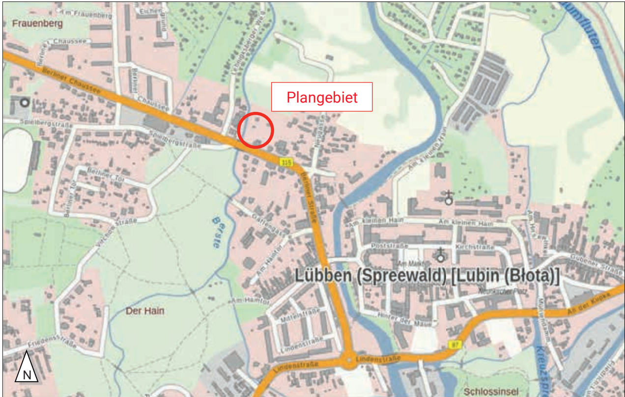
Darstellung ohne Maßstab