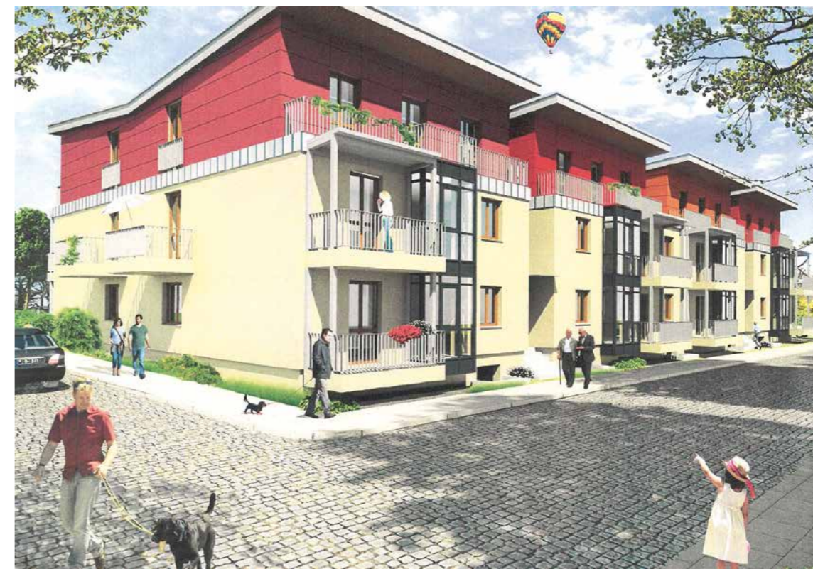
Schon beim Blick aufs visualisierte Computerbild lässt sich erahnen, wie komfortabel und exklusiv es sich hier wohnen lässt. Und in der Tiefgarage können bei Bedarf problemlos Wallboxen nachgerüstet werden.

Neben der lebens- und liebenswerten Idylle der Spreewaldstadt bekommen die künftigen Mieter ein konsequent auf energetische Standards ausgerichtetes neues Zuhause mit fast gänzlicher Barrierefreiheit. „Alle 17 Wohneinheiten sind bequem mit einem Aufzug von der Tiefgarage bis zum Dachgeschoss in Holzbauweise erreichbar. Auch zwei Hauseingänge auf beiden Seiten sind vorhanden“, beschreibt Frank Freyer das Vorzeigeobjekt des einzigen städtischen Wohnungsbaunternehmens und größten Vermieters der Stadt. Gemietet werden können 6 Zweiraum-, 7 Dreiraum- und 4 Viererwohnungen zwischen 74 und 92 Quadratmetern. „Jede Wohnung hat einen Balkon und einen Mieterkeller. Es gibt einen separaten Fahrradabstellraum, in der Tiefgarage befinden sich 15 Pkw-Stellplätze. Zwei weitere Mieter-Parkplätze werden vor dem Mehrfamilienhaus angelegt“, ergänzt der LWG-Geschäftsführer.