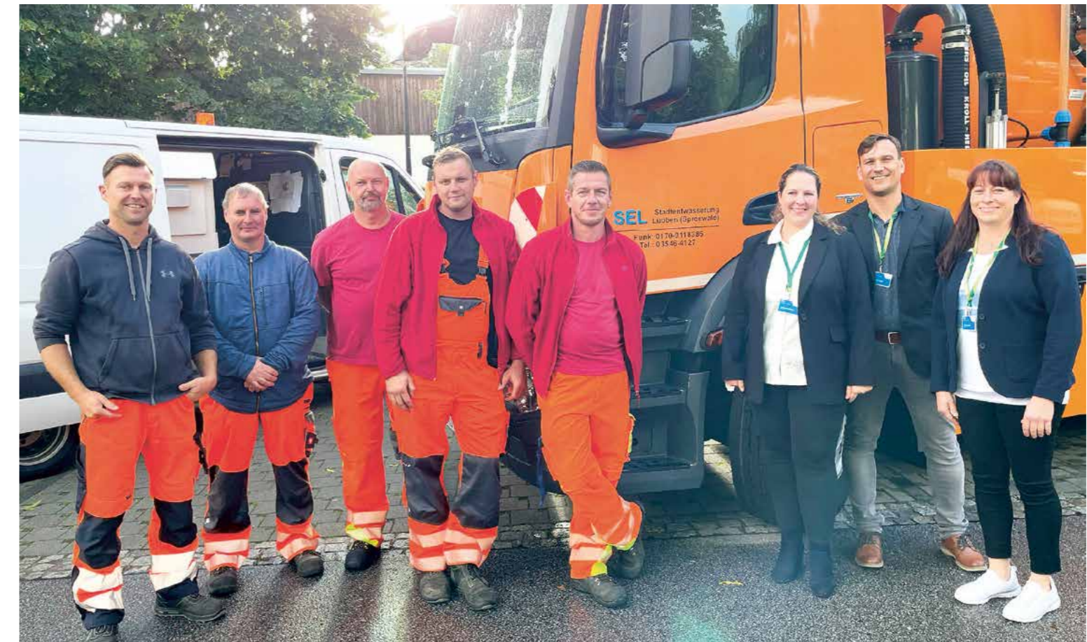
Ein Teil des erfolgreichen Teams der Stadtentwässerung Lübben.

Zum kleinen Jubiläum gibt's eine bemerkenswerte Bilanz