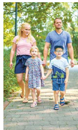
Auch beim gemütlichen Spaziergang in Familie kann man Rätselspaß haben.