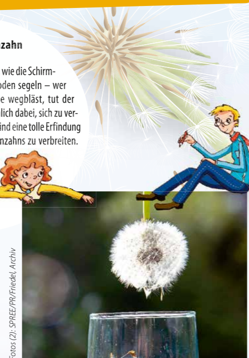
Nach dem kurzen Wasserbad: Die Löwenzahnsamen sind noch intakt und trocken, weil die Samen wasserabweisend sind.

Pflücken, pusten und zusehen, wie die Schirmchen durch die Luft Richtung Boden segeln – wer gerne die Samen der Pusteblume weghäuft, tut der Pflanze etwas Gutes. Er hilft ihr nämlich dabei, sich zu vermehren. Die weißen Fallschirmchen sind eine tolle Erfindung der Natur, um die Samen des Löwenzahns zu verbreiten. Sie fliegen etwa 16 km weit, bei Aufwinden legen sie auch mal Tausende von Kilometern zurück – sogar über Ozeane.