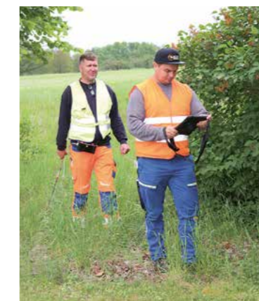
Sicher? Der Gasspürer zweifelt ...