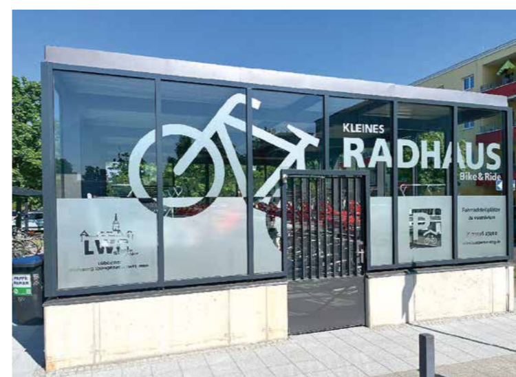
Es ist nicht zu übersehen, das neue Radhaus am Bahnhof.

Er kommt bei jedem Wetter unter in seinem LWG-„Drahtesel-Stall“