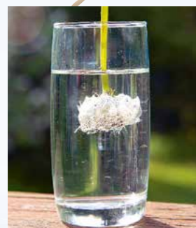
Die Pusteblume ist kopfüber im Wasser: Die Samenstände werden vom Wasserdruk zusammengedrückt.

Fülle Wasser in ein Glas und tauche die Pusteblume senkrecht komplett ins Wasser. Du glaubst, jetzt hast du den weißen Blütenball ruiniert? Nun ja, zunächst sieht er auch ganz zerquetscht aus. Nun hole die Pusteblume langsam wieder aus dem Wasser. Nanu, wie durch Zauberhand ist sie auf einmal wieder trocken und mit etwas Glück noch ganz.