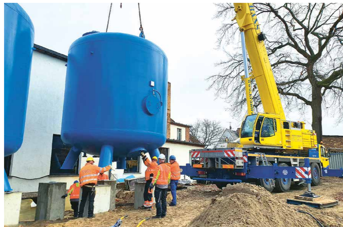
Zur Färbungsreduzierung des neuen Rohwassers erhielt das Wasserwerk zwei neue Filterkessel.