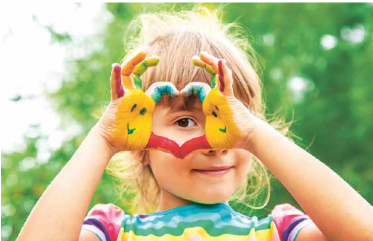
Ein wirklich buntes Programm hat die TKS für den Lübbener Kindersommer vorbereitet.