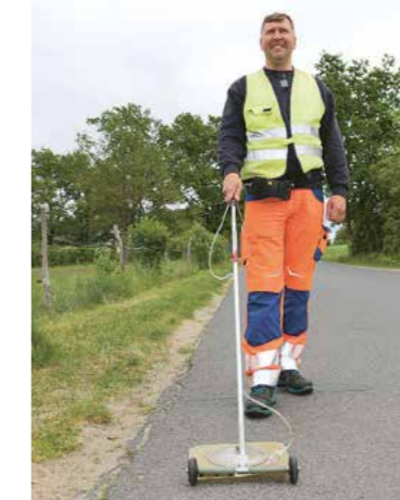
... und wechselt auf die Straße.