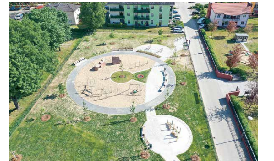
Der Spielplatz aus der Vogelperspektive: Er bietet viel Platz für Bewegung, Spiel und zum Verweilen.