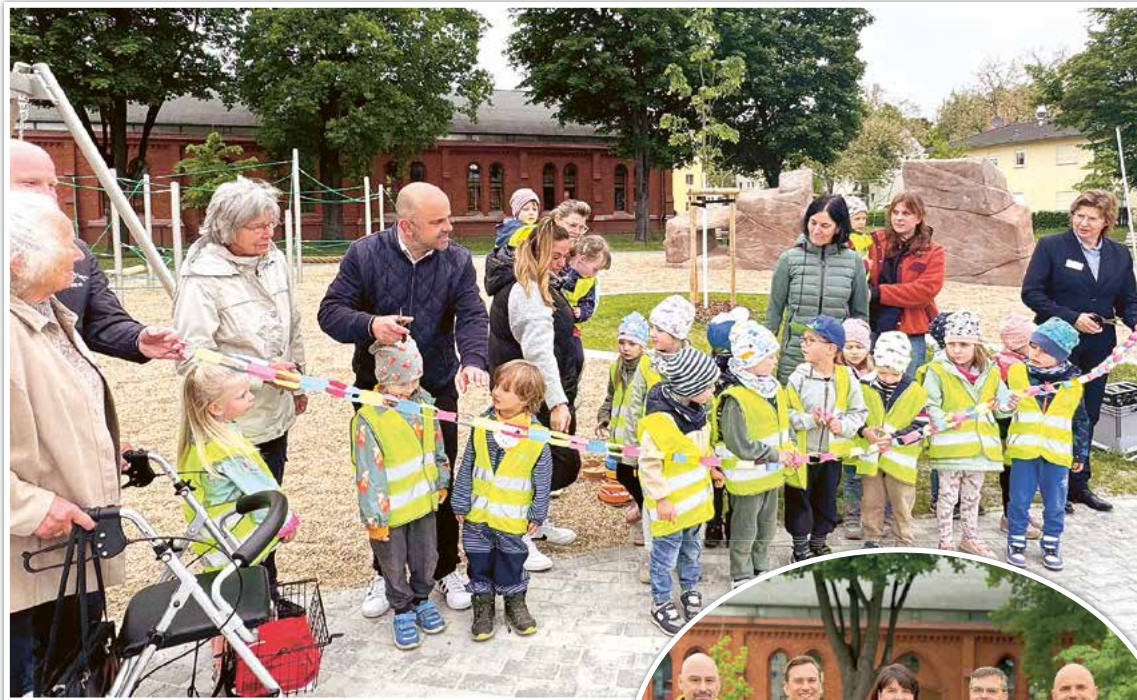
Der neue Spielplatz als Ort der Begegnung wurde eröffnet.

Und nun das gemeinsame, halbjährlich erscheinende KUNDENJOURNAL. Die Antwort auf die Frage, warum sie die Einladung