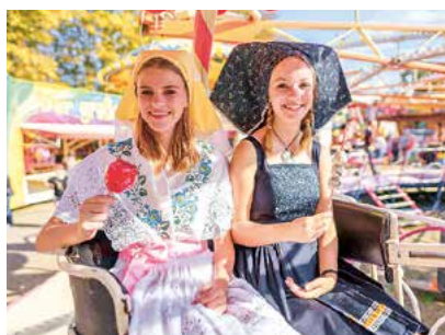
Zum Spreewaldfest tragen sorbische Mädchen und Frauen niedersorbische Festtagstracht oder Trachtenmode.